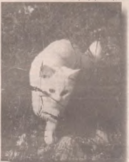
ку. Цветам процедура не повредит, а кошке уже не захочется нюхать букеты.