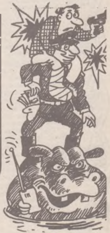
организаторами преступлений, успел скрыться, и нахождение его неизвестно. Так же как и большей части проданного им "дефицита".

Дело, возбужденное прокуратурой по факту исчезновения сотрудника милиции, и привело к разгрому банды. Сыщики областного уголовного розыска одним из первых задержали главаря. Кроме конфискованных у него автомобилей BMW и "восьмерки", удалось изъять 13 пистолетов "ТТ", боеприпа-