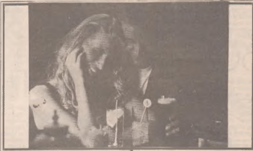
... не меркнет свет, пока горит