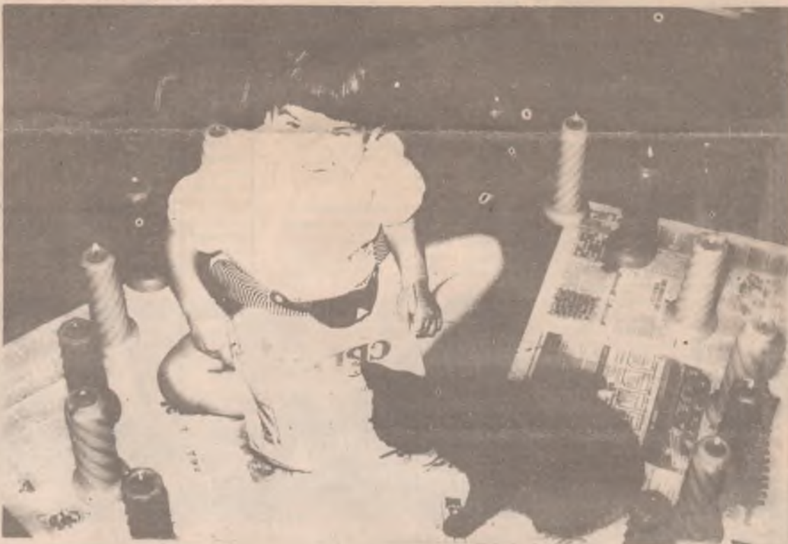
Понапишут же, черти - животик надорвешь!

Ему объяснили, что война закончилась свыше тридцати лет назад. Сталин давно умер, и по амни-