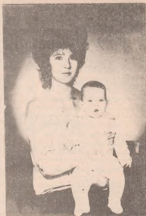
Мама и Зяба