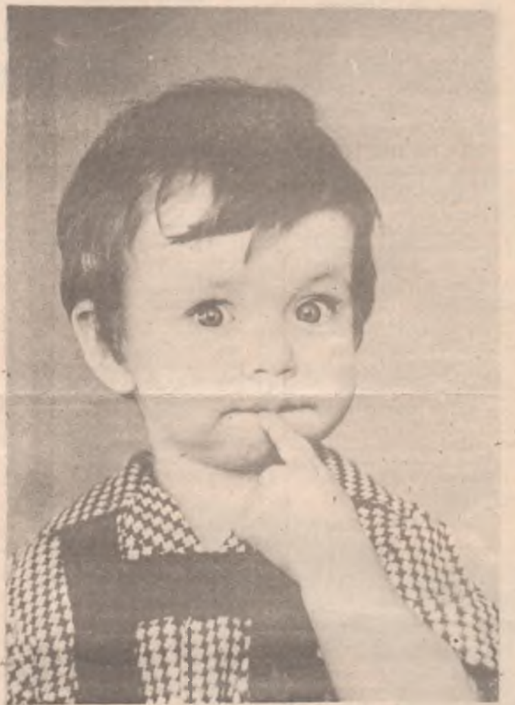
Ой, Лех, Леха...