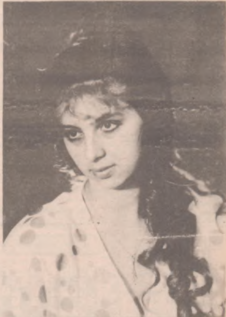
Итак, она звалась Татьяна!

Есть у нас и условия: не забудьте на конверте указать полный обратный адрес, имя, фамилию. Если не хотите, чтобы публиковали вашу фамилию, сделайте приписку "фамилия только для сведения редакции".