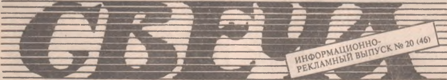
... Не меркнет свет, пока горит

ИНФОРМАЦИОННО-РЕКЛАМНЫЙ ВЫПУСК № 20 (46)