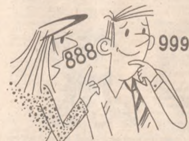
В одно влетело - в другое вылетело...

* Абориген Австралии становится холостяком, если скажет своей жене единственное слово: "Уходи!". Женщина же, чтобы получить развод,