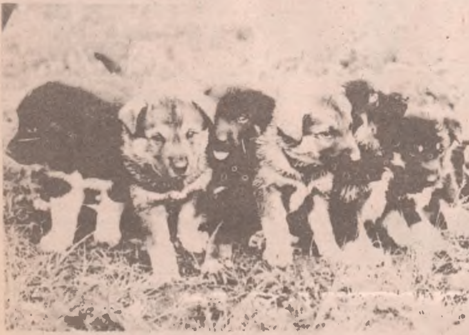
Живые деньги... Нынче собачки в цене, стерегут квартиры, идут на мясо и шубы, несмотря на то, что лучшие друзья человека. И все же чертовски красивы.